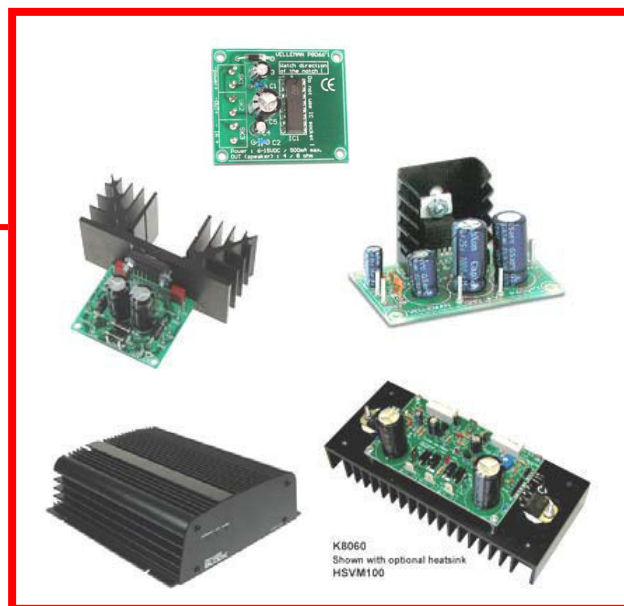
Amplificadores Ex.: K8066, K4001, K4003, K8081, K8060...