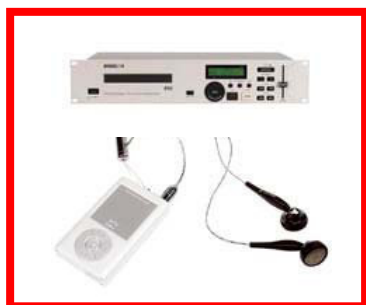
Leitor de cds e mp3...