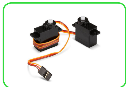
9G SERVO-MOTOREN (VR006)