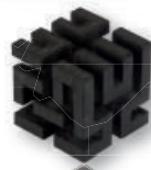
Hilbert Cube by Ibuser