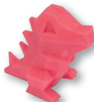
Low-Poly Torodile by FLOWALISTIK