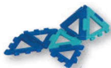
Customizable hinge/snap Octahedron net by mathgrnt