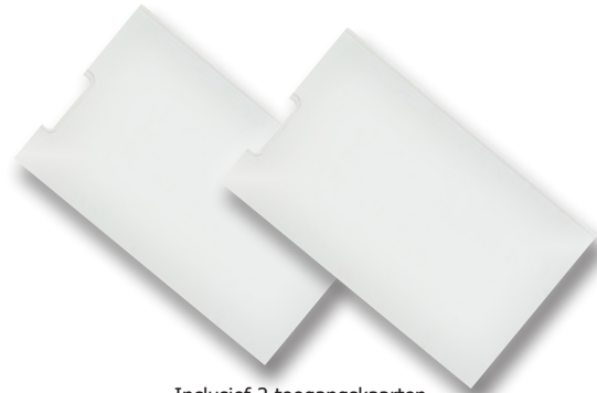
Inclusief 2 toegangskarten part# HAA2866/TAG2