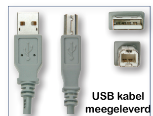
USB kabel meegeleverd