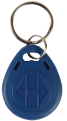
tarjeta de acceso para llavero part # HAA2866/TAG2