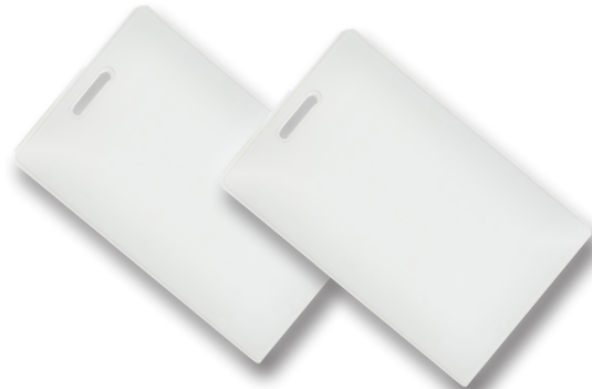
Se entrega con dos tarjetas part # HAA2866/TAG