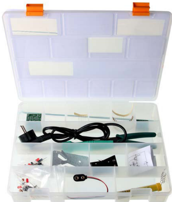
Coffret de rangement pratique