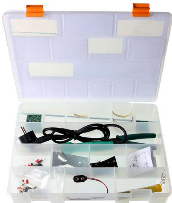
Einer praktischen Ablagebox